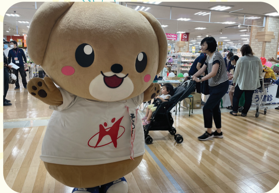
熊本県総合保健センターマスコットキャラクター 「そうぼくん」