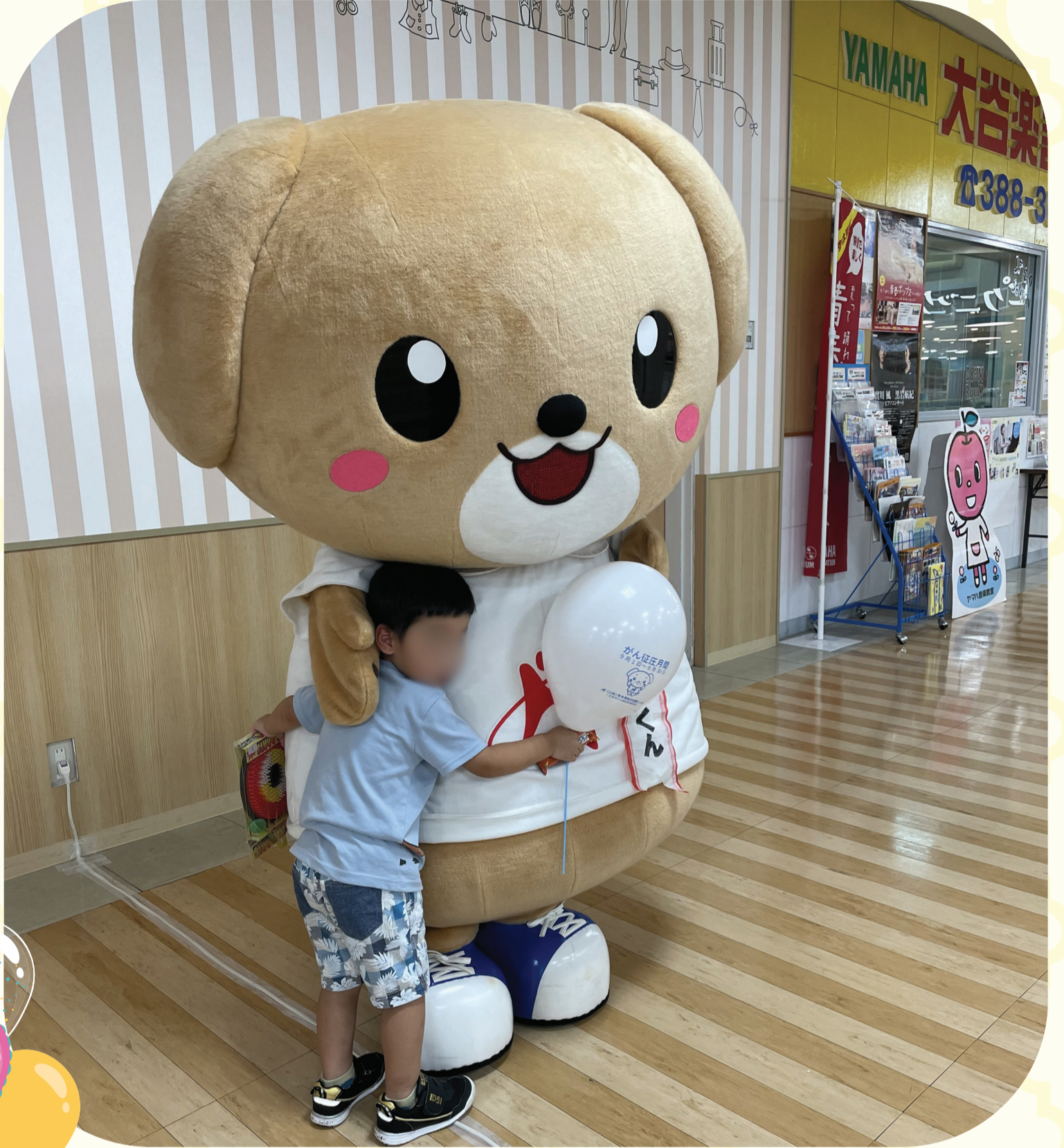
今年のイベントの様子